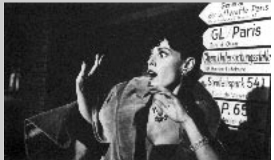
Kiss of the Spider Woman